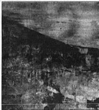
Et av Anna-Eva Bergmans malerier, «Bateau no. 7» fra 1958, som vises i Harstad under Festspillene i Nord-Norge

■ Den verdenskjente svenske kunstneren Anna-Eva Bergmans nordnorske billedverden står i fokus under Festspillene i Nord-Norge som åpner i Harstad denne helgen. I Galleri Nord vises for første gang 25 malerier og 12 grafiske blad som alle henter motiv fra Nord-Norge. Bergman (1909-1987) foretok to lengre reiser langs norskekysten. Første gang i 1950, senere i 1964 sammen med ektemannen, billedkunstneren Hans Hartung. Skisse og fotomateriale bearbejdet hun i sitt hjem i Antibes i Sør-Frankrike. Festspillutstillingen er kommet i stand i samarbeid med «Fondation Hans Hartung et Anna-Eva Bergman» og Gal-