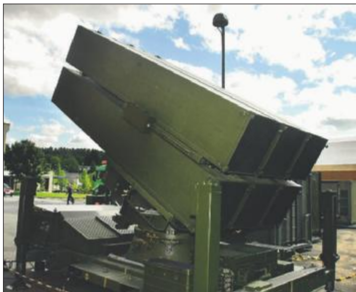
NASAMS: Beskyttelse mot angrep fra luften. Utskyningsramper fotografert i Kongsberg Næringspark.