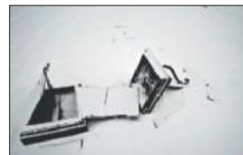
ØDELAGT: Flere av de gamle gravstøttene er ødelagt.

I tillegg til gravskjendingen later det til at gjerningspersonen har tatt med seg et kors fra en av støttene og brukt det til å